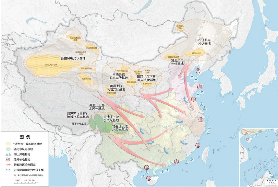
图 1 清洁能源基地布局示意图